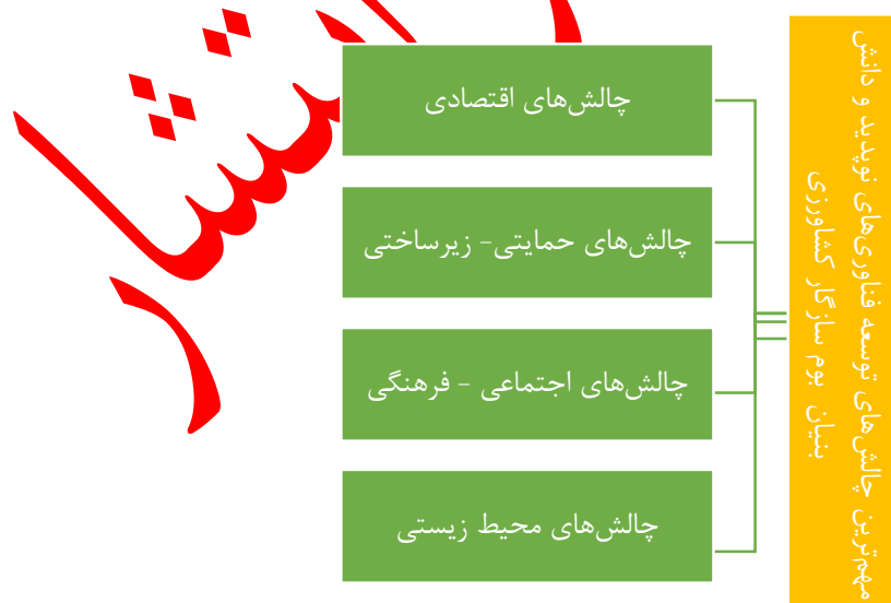
شکل ۱. مدل مفهومی تحقیق

بررسی مطالعات مذکور نشان می‌دهد اگر چه هر یک از این مطالعات سعی کرده‌اند تا موانع و مشکلات کاربرد فناوری‌های نوپدید و دانش‌بنیان بوم‌سازگار کشاورزی را نشان دهند، اما کمتر به طور مستقیم و جامع کل فناوری‌های نوپدید و دانش‌بنیان بوم‌سازگار را مورد مطالعه و بررسی قرار گرفته داده‌اند. بنابراین در مطالعه حاضر سعی شده است تا چالش‌های کاربرد توسعه فناوری‌های نوپدید و دانش‌بنیان بوم‌سازگار کشاورزی استان مازندران شناسایی شوند.