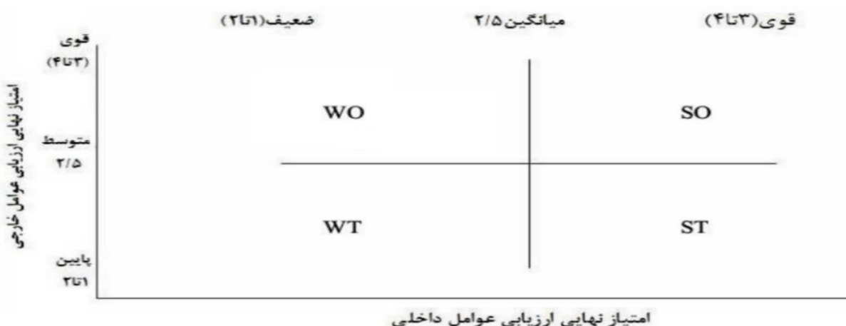
شکل ۱- ماتریس داخلی- خارجی برای تعیین فضای راهبردی پروژه

ماتریس SWOT در هر مرحله دو عامل با یکدیگر مقایسه می‌شوند. هدف در این ماتریس این نیست که بهترین راهبردها مشخص شوند، بلکه هدف تعیین راهبردهای قابل اجرا است. بنابراین، تمامی راهبردهایی که در ماتریس SWOT ارائه می‌شوند، انتخاب و اجرا نخواهند شد.