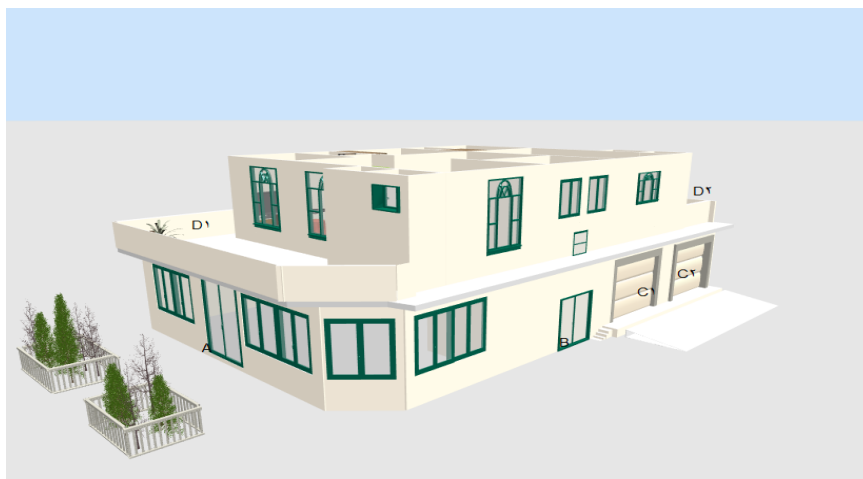
شکل ۶: پلان خانه روستایی مغازه‌دار در دوره مدرن (بعد از سال ۱۳۸۰)

بخش بالایی مسکونی است. بخش مسکونی شامل دو واحد خانه‌ی مستقل می‌باشد. در این خانه، حیاط وجود ندارد و از بالکون به عنوان حیاط استفاده می‌شود. به گفته ساکنان خانه، عدم وجود حیاط برایشان از نظر حریم خصوصی و امنیت خانوادگی محدودیت و