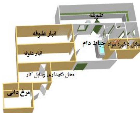
شکل (۵): طرح شبیه‌سازی خانه در دوره مدرن در خانه کشاورز و دامدار

ساختار خانه روستایی در دوره مدرن (۱۳۸۰ به بعد) در این دوره در نتیجه گسترش مدرنیته و آوردن امکانات بیشتر به روستا و نیز حمایت مالی نهادهای دولتی و مردمی و اجرای طرح‌های هادی روستا و مقاوم سازی و نوسازی خانه‌های روستایی، تقریباً همه خانه‌های روستا نوسازی شده‌اند. تعداد خانه‌های روستا طبق آمار سال ۱۳۹۱ به ۲۷۹ و به گفته اهالی در سال ۱۳۹۴ به بیش از ۴۰۰ خانوار رسیده است. پست بانک، مخابرات و اینترنت در روستا وجود دارد. در ساخت خانه از مصالح بیرونی استفاده شده است. طرح و مدل خانه به صورت مدل شهری و به نوعی مدل غربی در آمده است. شکل (۵) طرح شبیه‌سازی خانه فرد دامدار و کشاورز در روستای گل تپه را نشان می‌دهد. این خانه در سال ۱۳۷۶ بنا شده است. این خانه به دو بخش مسکونی و جایگاه دام تقسیم شده است. بخش مسکونی در این دوره به مکانی خارج از محدوده خانه در دوره