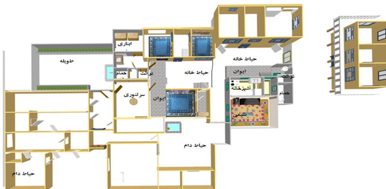
شکل (۴): طرح شبیه‌سازی خانه روستایی (مورد پژوهش) در دوره‌ی نیمه مدرن (۱۳۸۰-۱۳۶۰)

صاحب زمین کشاورزی شدند افراد بی زمین دوره قبل بودند و عده‌ای هم پسرانی بودند که از خانه‌ی پدری جدا شده، خانواده تک هسته‌ای تشکیل داده بودند. تک هسته‌ای شدن خانواده‌ها، تعداد خانوارهای روستا را افزایش داد که این نیز به قطعه قطعه شدن اراضی کشاورزی انجامید. اراضی واگذار شده متعلق به مالکان روستا بود که توسط دولت مصادره شده بود. این اراضی نسبت به اراضی واگذار شده در دوره قبل هم از نظر مساحت کمتر بود و هم از نظر مرغوبیت زمین کشاورزی از کیفیت کمتری برخوردار بودند. شکل (۴) تغییرات به‌وجود آمده در خانه مورد مطالعه را در دوره نیمه مدرن نشان می‌دهد. بخش‌های مدرن در این تصویر به رنگ (سیمانی) و بخش سنتی به رنگ کاه‌گل نشان داده شده است. درب این دو خانه با حیاط مشترک مشاهده می‌شود که با خط فرضی سیاه رنگ محدوده دو خانه از هم جدا شده است. خانه اول (سمت چپ تصویر) تغییرات خانه را در دهه‌ی هفتاد و خانه دوم (سمت راست تصویر) تغییرات صورت گرفته در دهه هشتاد خورشیدی را نشان می‌دهد. ساکنان خانه اول، دامدار و ساکنان خانه‌ی دومی، مغازه‌دار هستند. در خانه اول با توجه به شغل ساکنان، بخش‌هایی از خانه و بخش دام