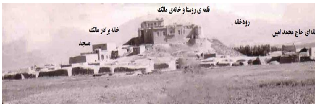
شکل ۱: روستای گل تپه در سال ۱۳۴۵ خورشیدی

Kil ۱ «کول» به معنی دوش، کتف و شانه می‌باشد.