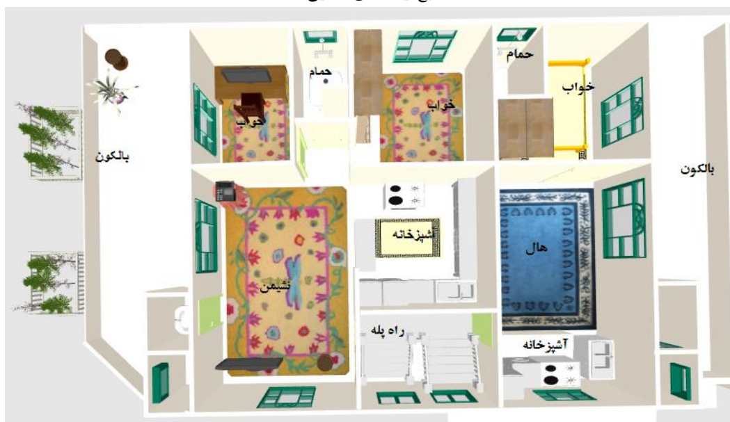
شکل (۷): پلان بخش مسکونی خانه مغازه‌دار روستایی در دوره مدرن (۱۳۸۰ به بعد)