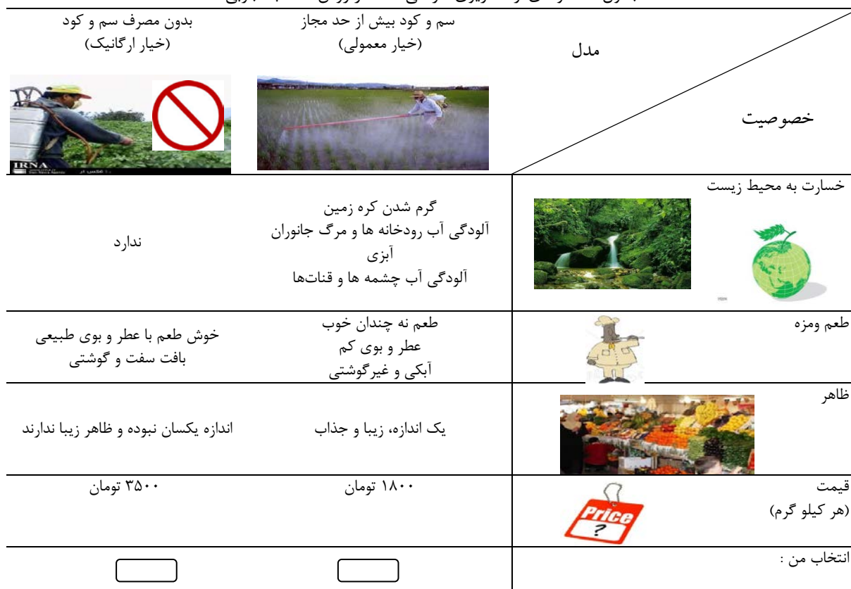
جدول ۲- نمونه‌ای از سناریوی طراحی شده در روش انتخاب تجربی