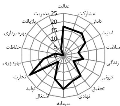
نمودار ۱- وضعیت توجه به مقوله‌های خاص پایداری در سیاست‌های کلی برنامه‌های دوم تا پنجم

بر اساس این یافته‌ها، وضعیت توجه به پایداری در برنامه‌های توسعه کشور روندی تقریباً صعودی داشته است و در دو برنامه اخیر توسعه، از شیب بالارونده به نسبت خوبی برخوردار بوده است که بیانگر بهبود جایگاه اندیشه توسعه پایدار در اذهان سیاست‌گذاران می‌باشد (نمودار ۳).