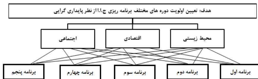
شکل ۱- سلسله مراتب اولویت‌بندی سیاست‌های بخش کشاورزی در برنامه‌های پنج‌ساله ج.ا.ا.

در این مقاله دوره زمانی پس از پیروزی انقلاب اسلامی مورد توجه بوده و با توجه به هدف، اسناد سیاستی بالادستی اثرگذار بر سیاست‌گذاری کشاورزی شامل قانون اساسی، سند چشم‌انداز بیست ساله، سیاست‌های کلی نظام، سیاست‌های کلی برنامه‌های پنج‌ساله توسعه و همچنین، سیاست‌های کلی بخش کشاورزی در اسناد برنامه‌های اول تا پنجم مورد تحلیل قرار گرفتند. اعتبار تحلیل محتوای انجام شده طبق شیوه تعیین اعتبار مقارن، که در آن اطلاعات تحلیل محتوا با معیارهای متعدد موجود در منابع معتبر مقایسه می‌شود (Holsti, 1969)، با به‌کارگیری جدول (۱)، به عنوان معیار معتبر، تایید گردید. به منظور تعیین پایایی، ابتدا کدگذاری توسط محققان انجام شد و سپس، بر اساس واحدهای محتوای موجود، کدگذاری مجدد توسط اساتید متخصص در حیطه توسعه و کشاورزی پایدار به صورت جداگانه انجام گرفت. بر اساس توافقات موجود بین دو کدگذاری انجام شده، قابلیت اعتماد ۰/۹۶ مشخص گردید.