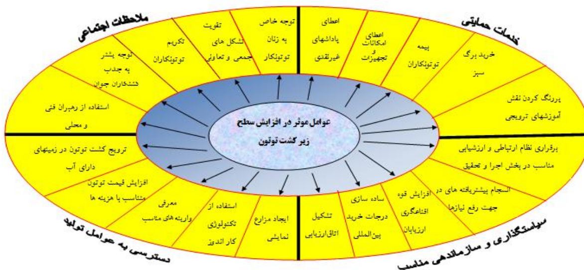
شکل ۳- الگوی مفهومی پیشبرنده‌های توسعه کشت توتون