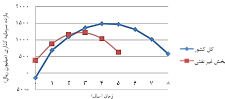
شکل ۳. چگونگی بازده یک میلیارد ریال سرمایه‌گذاری کل کشور و بخش غیرنفتی کشور

وقفه برای بخش‌های دیگر این نتایج به دست آمد: نیمی از بازده سرمایه‌گذاری برای بخش غیرنفتی ۲ سال و ۲۴۴ روز و به طور میانگین برای همه بخش‌های سرمایه‌گذار کشور (کل کشور) ۴ سال و ۱۳۱ روز به دست می‌آید. از این رو به طور متوسط سرعت بازده سرمایه‌گذاری بخش کشاورزی به نسبت کل کشور بیشتر، و به نسبت بخش غیرنفتی کمتر است. برای مشاهده سهم هر دوره از بازده کل سرمایه‌گذاری از ضرایب با وقفه استاندارد شده استفاده کرده‌ایم که از رابطه زیر به دست می‌آید: