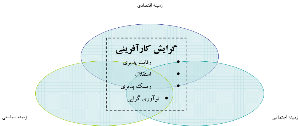
شکل ۱- چارچوب نظری تحقیق

بر اساس مطالعه Li et al. (2008)، بین گرایش کارآفرینی و عملکردهای مطلوب سازمانی رابطه معنی‌داری گزارش شده است. مطالعه Engelen (2010)، نشان داد که عوامل داخلی ساختار سازمانی، سبک رهبری و فرهنگ سازمانی بر ابعاد گرایش کارآفرینی شرکت‌ها نقش معنی‌داری دارد. لیکن، این روابط در شرکت‌هایی که در کشور آلمان بودند، متفاوت از شرکت‌های مشابه چینی می‌باشد. از این رو نتیجه گرفتند که وجود عوامل پیرامونی نقش بسیار مهمی در استقرار گرایش کارآفرینی شرکت‌ها دارد.